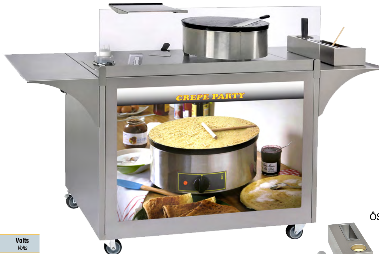
MC-03 + CFE 400 + CK 3 + Tablettes / Side Shelves

MC-03 : concept cart for crepes with illuminated display « Crepe Party »