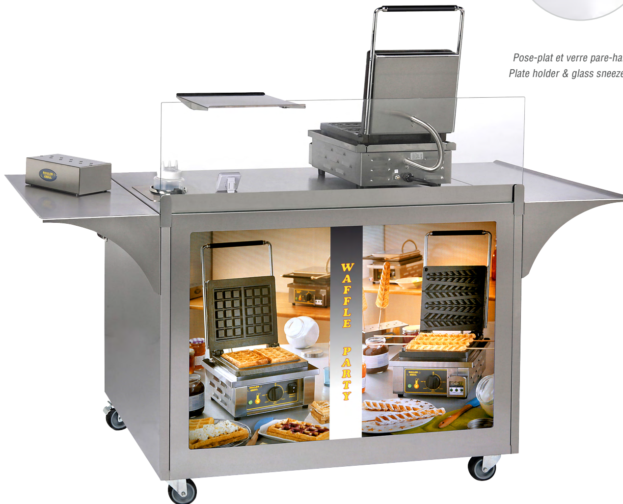
Pose-plat et verre pare-haleine / Plate holder & glass sneeze guard